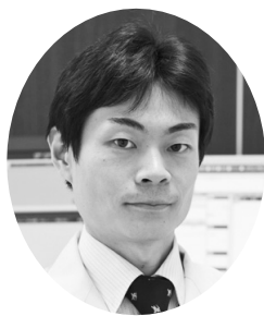
2005年、浜松医科大学医学部卒業。主な勤務先は、横浜市立大学附属病院、茅ヶ崎市立病院、小田原市立病院。2017年より鴨宮さとう内科クリニック開業。

(b) ウエスト周囲長によるスクリーニングで内臓脂肪(腸のまわり)に蓄積した脂肪の蓄積を疑われ、腹部CT検査によって確定診断された内臓脂肪型肥満。この場合、健康障害を伴いやすい高リスク肥満と位置づける。